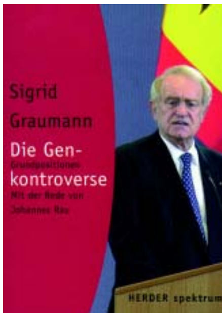
Gelesen und bewertet: Das Neueste aus den Verlagen im Bücherforum ..... ab Seite 36