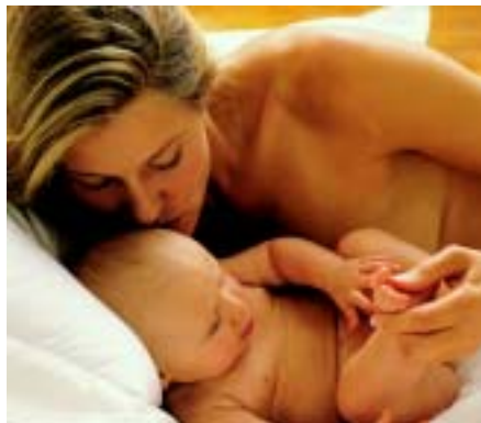
Eine alte Frage neu gestellt: Ab wann ist der Mensch ein Mensch? ..... Seite 14