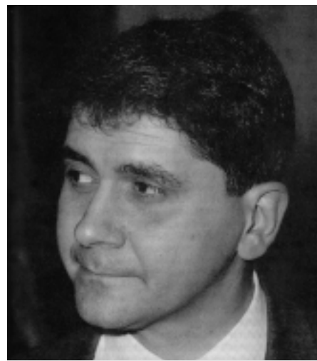
Rocco Buttiglione, Jahrgang 1948, ist Minister für Europa-Angelegenheiten im italienischen Kabinett. Der Politikwissenschaftler ist zudem Vorsitzender der Vereinigten Christdemokraten (Cristiani Democratici Uniti).

Wenn wir deshalb gegenwärtig in Italien bemüht sind, jene Frauen zu unterstützen, die nicht abtreiben wollen, so ist dass nur der Einstieg in eine neue Familienpolitik, die es jungen Paare erleichtert, eine Familie zu gründen. Wir wollen die Beziehungen zwischen jungen Familien und ihren Eltern stärken; wir wollen den Arbeitsmarkt reformieren, um Arbeitszeiten und die notwendige Zeit für die Familie besser aufeinander abzustimmen; wir wollen die Stellung der Familie in Erziehung und Kultur fördern. Voraussetzung dafür sind eine größere Steuergerechtigkeit für Familien und eine Erhöhung des Kindergeldes.