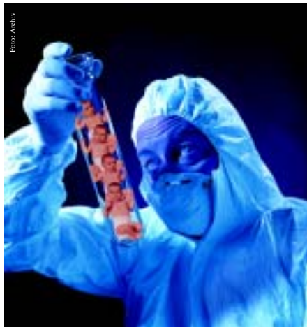
Mit PID besser forschen, klonen, Kinder kriegen ..... Seite 16