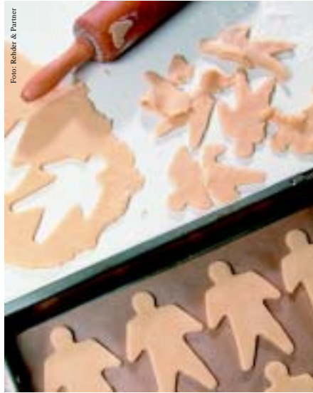
Regierung gegen Bundestag zu Klonverbot: „So kann man das nicht machen“ .... Seite 4