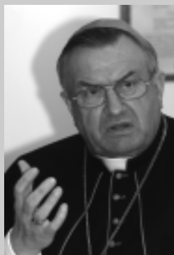
Karl Kardinal Lehman

„Die PID verstößt gegen Embryonenschutzgesetz und Grundgesetz.“