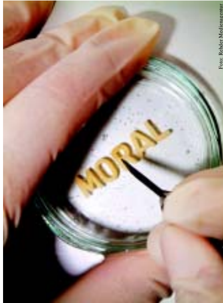
Bleibt die Ethik bei der Forschung im Labor auf der Strecke? ..... ab Seite 4