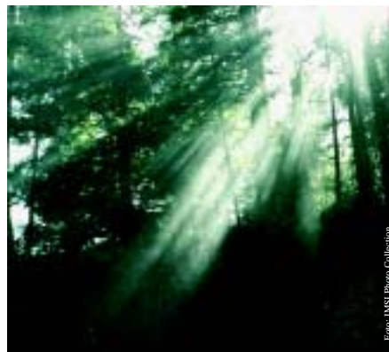
Das Wunder von Arkansas - Mann erwacht aus jahrelangem Koma ..... Seite 36