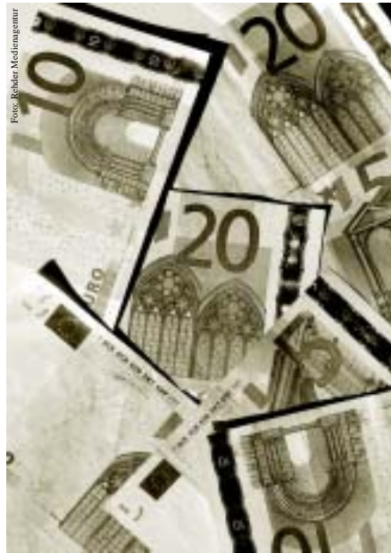
Lug und Trug der Familienpolitik .... Seite 17