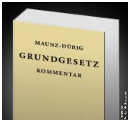
Neuer Grundgesetzkommentar: Die Würde des Menschen wird antastbar ..... Seite 17