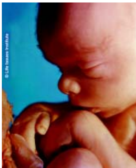
Bericht über eine Tagung der katholischen Akademie Freiburg ..... Seite 19