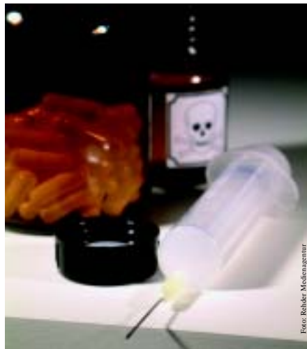
Erfahrungen der Niederländer, Belgier und Schweizer mit der Euthanasie ..... Seite 8