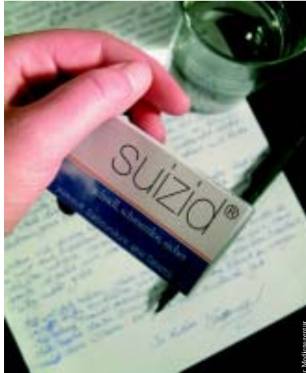
Befürworter der Tötung auf Verlangen suchen europäische Hintertüren ..... ab Seite 4