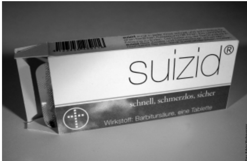
Noch pure Fiktion: Der schnelle Tod auf Rezept

Auseinandersetzung, die Bewegung in die noch immer breite Front einer Ablehnung der aktiven Tötungshilfe bringen soll. Zunächst schien der Europarat jeder Ver-