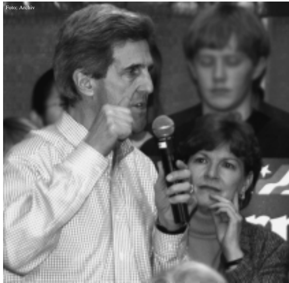
Bush Herausforderer John Kerry: Der katholische Demokrat befürwortet Abtreibungen.

Hart umkämpft war auch die Entscheidung über die embryonale Stammzellforschung. Als Kompromiss wurde schließlich am 9. August 2001 festgelegt, dass staatliche Fördermittel nur für die Forschung an den 60 Stammzelllinien be-