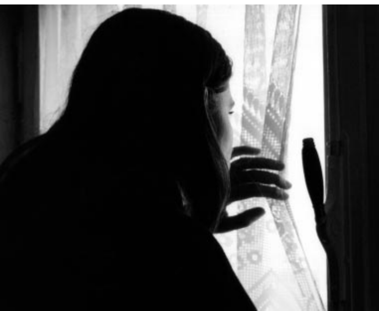
Heilung erfordert einen mit der Abtreibungsthematik vertrauten Therapeuten.

wiederholt sich das Ereignis immer wieder. »Schreckliche Alpträume quälen mich seither jede Nacht. Darüber darf ich aber nicht sprechen. Tote Kinder – wohin ich sehe«, so eine betroffene Frau. Wie ihr geht es Expertenangaben zufolge fast der Hälfte aller Frauen nach einer Abtreibung, und das zum Teil viele Jahre lang. Träume von abgerissenen Gliedmaßen, dem grausamen Ermorden eines hilflosen Kindes oder vom eigentlichen Abtreibungsgeschehen wiederholen sich blitzartig manchmal auch im Wachzustand als so genannte Flashbacks – oft ausgelöst durch ein kleines Detail, das mit der Abtreibung in Verbindung gebracht werden kann,