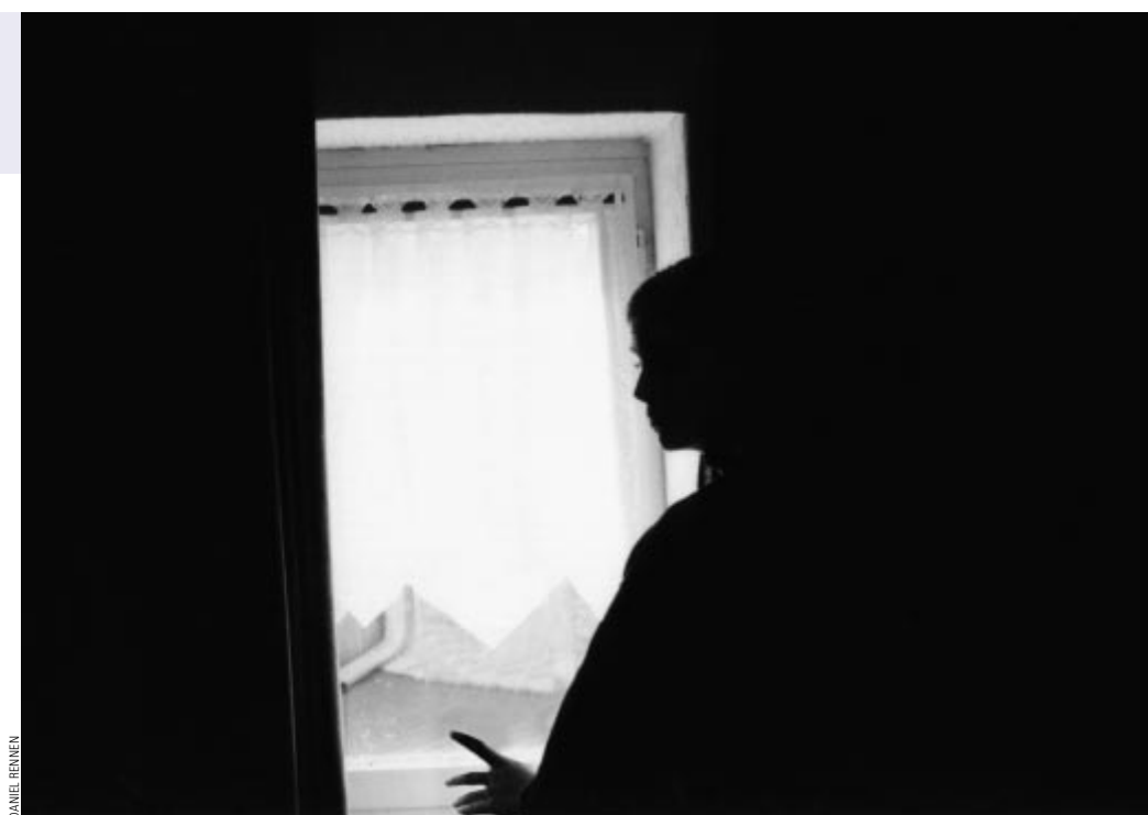
Depressionen und Stimmungsschwankungen beherrschen nach einer Abtreibung das Leben vieler Frauen.

politisch nicht korrekt ist, über die Auswirkungen der staatlich finanzierten und »rechtswidrigen, aber straffreien« vorgeburtlichen Kindstötungen im Rahmen der als frauenfreundlich propagierten Fristenregelung zu sprechen. Deshalb werden sie in den Medien und der öffent-