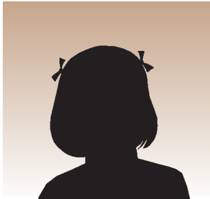
Sandra, heute 3 Jahre alt