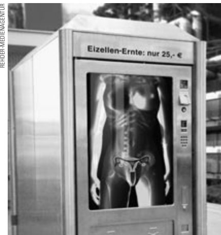
Sind noch Mangelware: weibliche Eizellen.

Ich mag ihre Zeitschrift. Auch dass Sie außer dem Lebensrecht des Kindes auch die Risiken beleuchten, die für Frauen mit der Abtreibung verbunden sind, finde ich gut. Aber genau da müssten Sie mehr tun. Schließlich sind wir Frauen die Leidtragenden. Unsere Eizellen werden »heiß begehrt« (LebensForum Nr. 75, S. 13). Wir sind die »Opfer einer biotechnologischen Sklaverei« (LebensForum Nr. 75, S. 3). Wir sollen die »Pille danach« und regelmäßig die »davor« schlucken. Wir sollen eine Hormonstimulation über uns ergehen lassen, wenn