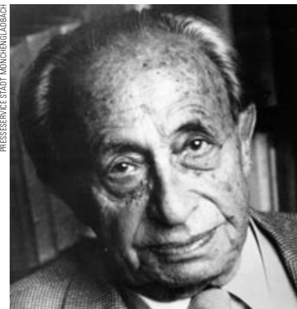
Hans Jonas (1903 - 1993)