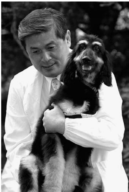
Hwang Woo Suk (links)