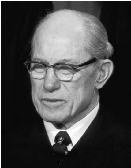
Richter White, Gegner von Roe v. Wade

Eine Mehrheit der Staaten, vor allem des Südens und des mittleren Westens, würde wohl zu mehr oder weniger strikten Abtreibungsverboten zurückkehren. In einigen existieren sogar noch alte Abtreibungsverbote von vor 1973, die dann wieder in Kraft treten könnten. Andere Staaten an der Westküste oder dem Nordosten würden dagegen höchstwahrschein-