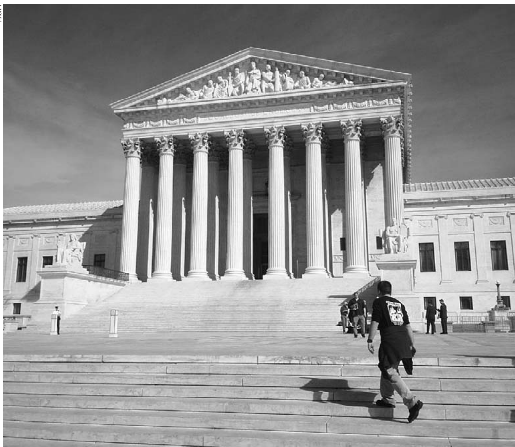
Der Supreme Court der USA in Washington D.C.

Präsident Clinton konnte in seiner Amtszeit wiederum zwei Richterstellen am Obersten Gerichtshof besetzen, diesmal mit klaren Befürwortern des »Rechts auf Abtreibung«, was im Jahr 2000 zu einem bitteren Rückschritt führte. Im