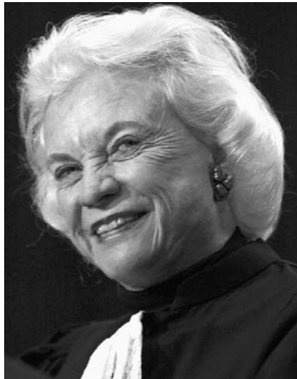
Richterin O'Connor, trat 2006 zurück

Die Ernennung von Roberts und Alito könnte aber durchaus Auswirkungen am Rande der Abtreibungsdebatte haben, da möglicherweise eine ähnliche Situation wie 1992 beim Casey-Urteil vorliegt. Während das prinzipielle Recht auf Abtreibung noch sicher scheint, könnte es dennoch eine 5:4-Mehrheit für weiterge-