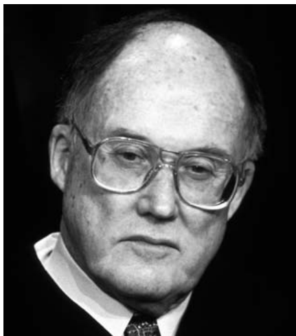
Richter Rehnquist, Gegner von Roe v. Wade

älteste Richter, der jemals Mitglied des Obersten Gerichtshofes war. Da das Vorschlagsrecht für einen neuen Kandidaten aber allein beim Präsidenten liegt und Stevens und die anderen eher linksstehenden Richter sich ihrer Bedeutung bei diesen äußerst knappen Mehrheitsverhältnissen bewusst sind, ist davon auszugehen, dass sie auf keinen Fall zurücktreten werden, solange Bush oder ein anderer pro-life eingestellter Präsident im Amt ist. Stevens mag sich in einer ähnlichen Situation sehen wie Blackmun 1992 beim Casey-Urteil, als dieser schrieb: »Ich bin 83 Jahre alt. Ich kann nicht ewig in