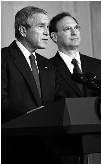
Präsident George W. Bush, Richter Samuel Alito

In den beiden exemplarischen Fällen, die der Oberste Gerichtshof 1973 entschied, unterstützte die pro-choice-Bewegung zwei Frauen, denen 1970 Abtreibungen in Texas und Georgia verweigert wurden. In der ersten Entscheidung, »Roe et al. v. Wade, District Attorney of Dallas County«, klagte Norma McCorvey unter dem Pseudonym Jane Roe gegen