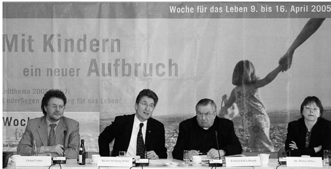
Pressekonferenz mit Bischof Huber und Kardinal Lehmann zu Beginn der »Woche für das Leben« im Jahr 2005.