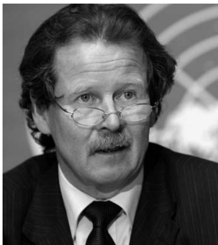
Manfred Nowak, UNO-Sonderbotschafter

»Falun Gong« ist der Name für eine uralte buddhistische Meditationspraxis, die heute von immer mehr Chinesen praktiziert wird. Einer Selbstdarstellung zufolge handelt es sich dabei um »ein hoch entwickeltes System um Herz, Geist und Körper zu reinigen und zu stärken«. Ursprünglich sei die Methode nur von einem Meister an seinen Schüler weitergegeben worden. 1992 soll sie dann von Li Hongzhi in China erstmals der Öffentlichkeit vorgestellt worden sein. Falun Gong soll jenen, die es praktizieren, helfen, »das Gleichgewicht von Körper und Geist wieder herzustellen« und »mit der Natur und den Prinzipien des Kosmos in Einklang zu kommen«. Auch wenn das Ziel der Meditation vor allem darin bestehe, die Falun Gong-Praktizierenden »zu Harmonie und Weisheit« zu bringen, werde der Meditationstechnik nachgesagt, sich positiv auch auf die Gesundheit der Betroffenen auszuwirken.