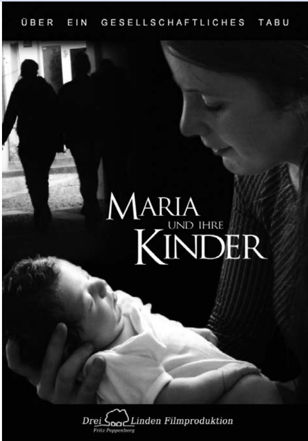
Der Film »Maria und ihre Kinder« – ab Mitte September 2007 auf DVD.

handelt. Doch der Priester war der Ansicht, dass ich lebendige Geschöpfe töte.«