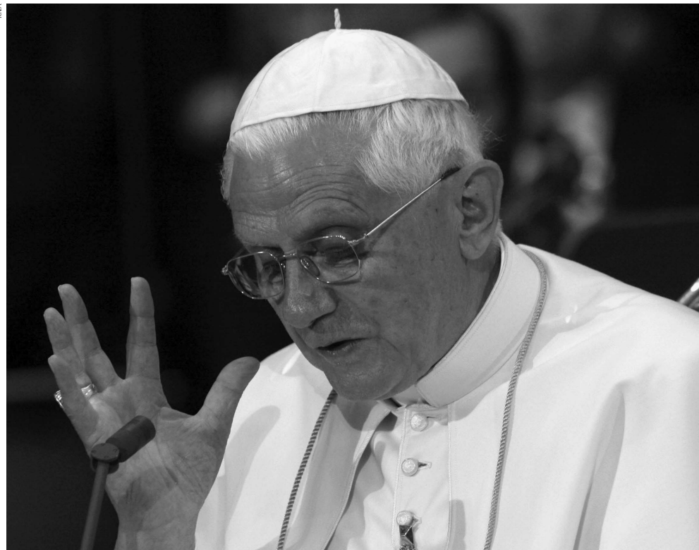
Papst Benedikt XVI.: Drückt dieser Mann sich missverständlich aus?

melden: »Unterdessen stellten kirchliche Stellen klar, der Papst habe bei seiner Rede am Freitag in der Hofburg keine Abschaffung der österreichischen Fristenlösung ge-fordert: Benedikt XVI. habe an die po-litisch Verantwortlichen