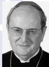
Joachim Kardinal Meisner

Der Erzbischof von Köln, Joachim Kardinal Meisner , hat mit deutlichen Worten auf den Skandal der Abtreibung aufmerksam gemacht. In einem Interview mit dem Radiosender Deutschlandfunk bezeichnete Meisner an Pfingsten die Deutschen als ein »geistvergeßenes Volk, das seine Kinder tötet«. Der Kölner Erzbischof, der wie kaum ein anderer Kirchenvertreter immer wieder mutig für den Lebensschutz eintritt, rügte zudem die CDU-Führung wegen der jüngsten Liberalisierung des Stammzellgesetzes. Meisner vertrat dabei die Ansicht, dass das Ergebnis wahrscheinlich anders ausgefallen wäre, wenn die CDU-Vorsitzende Angela Merkel und Bundesforschungsministerin Annette Schavan eindeutig gegen eine Verschiebung des Stichtages Stellung bezogen hätten. „Das erwarte ich von Mitgliedern der ‚C‘-Partei, dass sie privat und öffentlich sich mühen, nach dem Evangelium zu leben, sei es gelegen oder ungelegen“, so Meisner. malo