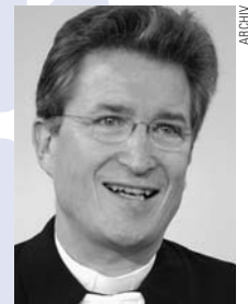
Bischof Wolfgang Huber

Der Vorsitzende des Rates der Evangelischen Kirchen in Deutschland, Bischof Wolfgang Huber , hat seinen Respekt gegenüber der Bundestags-Entscheidung zur Stichtagsverschiebung im Stammzellgesetz Ausdruck verliehen; einer Entscheidung, zu der Huber nicht unwesentlich beigetragen hat. Im Dezember 2006 hatte Huber in einem FAZ-Beitrag öffentlich für eine Verschiebung des Stichtages geworben und damit den Konsens der christlichen Kirche in Sachen Lebensschutz aufgekündigt. Obwohl sich zahlreiche evangelische Landesbischöfe und viele protestantischen Gruppierungen gegen eine Verschiebung aussprachen, blieb Hubers Position in der Öffentlichkeit als »die evangelische Position« im Gedächtnis. Nahezu alle Politiker der C-Parteien, die für eine Liberalisierung votierten, beriefen sich auf Huber. Die Stimmen dieser Politiker wären nötig gewesen, um die weitere Aufweichung des Embryonenschutzes zu verhindern. malo