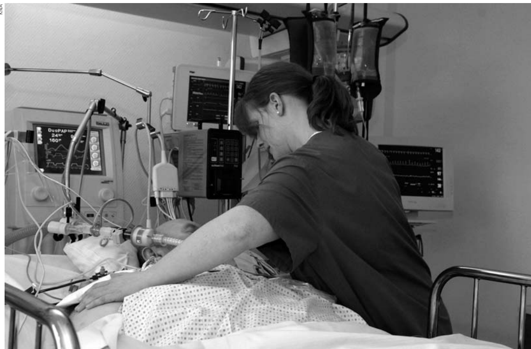
Patient auf der Intensivstation

Diese beiden Sichtweisen von Patientenverfügungen – einerseits als reine Behandlungsverzichtserklärung, die der Patientenautonomie gerecht wird, und andererseits als Mittel zur Durchsetzung