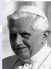
Papst Benedikt XVI.

Papst Benedikt XVI. hat die Jugend der Welt zum Abschluss des Weltjugendtages in Sydney in Australien zu einem verstärkten Einsatz für den Lebensschutz aufgerufen. Während der Freiluftmesse auf dem Gelände der Rennbahn von Randwick sagte der Papst, eine neue Generation von Christen sei gefordert, eine Welt mit aufzubauen, »in der Gottes Geschenk des Lebens willkommen, respektiert und geschätzt ist, nicht zurückgewiesen, gefürchtet und zerstört wird«. Die jugendlichen Pilger rief der römische Pontifex auf, »Boten der Liebe« zu werden. »Die Welt braucht diese Erneuerung«, so Benedikt XVI. An der Abschlusszeremonie mit dem Papst nahmen rund 400.000 Gläubige teil. Zu dem sechstägigen Treffen waren insgesamt Jugendliche aus 170 Nationen nach Australien gekommen.