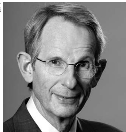
Bundesärztekammer-Präsident Jörg-Dietrich Hoppe

Die Diskussion um die Legalisierung der aktiven Sterbehilfe in Deutschland bleibt weiterhin akut. Dies hat die letzte Ausgabe des LebensForums einmal mehr verdeutlicht. Wie das Interview mit BÄK-Präsident Jörg-Dietrich Hoppe zeigt, scheint die Ärzteschaft die Euthanasie erfreulicherweise abzulehnen. Dies und die großen Erfolge der Palliativmedizin und Hospizbewegung sind gute Argumente, die sich gegen die »Tötung auf Verlangen« anführen lassen. Wenn wir nicht wollen, dass es zukünftig zu einem