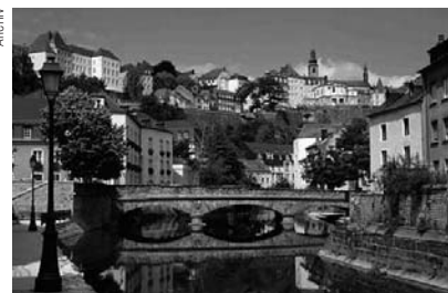
Blick auf das Großherzogtum Luxemburg

Luxemburg. Im Großherzogtum Luxemburg wird sich die endgültige Abstimmung über das geplante Euthanasiegesetz voraussichtlich bis ins Frühjahr 2009 verzögern. Grund sind Bedenken des Luxemburger Staatsrats im Hinblick auf das im Februar in erster Lesung beschlossene Gesetz. Der Staatsrat kritisiert, dass die geplante Neuregelung nicht ausreichend für Rechtssicherheit Sorge. Der von Sozialisten und Grünen initiierte Gesetzentwurf geht in mehreren Punkten über das bel-