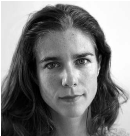
Rebecca Gomperts: Abtreibung per Online-Bestellung

An dieser Stelle möchte ich einmal meinen herzlichsten Dank für das »LebensForum« aussprechen. Diese Zeitschrift stellt für mich neben einer Plattform des Austausches und neben einer Informationsbörse zugleich auch einen stets neuen Ansporn dar. Denn wie sagt man: »Wissen schafft Verantwortung!«