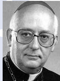
Georg Kardinal Sterzinsky

Der Erzbischof von Berlin, Georg Kardinal Sterzinsky , hat die Veranstalter des FI-APAC-Kongresses, der sich Ende Oktober in Berlin mit den Themen Abtreibung und Verhütung beschäftigte, attackiert. Statt zum Leben zu ermutigen, wolle der Kongress, »die Abtreibung perfektionieren«, so Sterzinsky. Der Kardinal beklagte den technokratischen Umgang der Veranstalter mit dem Thema und kritisierte, dass Abtreibungen als »die normalste Sache der Welt« betrachtet würden. »Dass Menschenleben getötet werden, erschreckt offenbar niemand mehr, wenn es nur in verharmlosender Weise mit Fachbegriffen ausgesprochen wird.« Auch werde vergessen, dass Abtreibungen nach deutschem Recht »rechtswidrig« seien, so Sterzinsky weiter. Besonders zynisch sei, dass der Kongress auch vom Berliner Hebammenverband unterstützt werde, obwohl Hebammen doch eigentlich dem Leben dienen sollten.