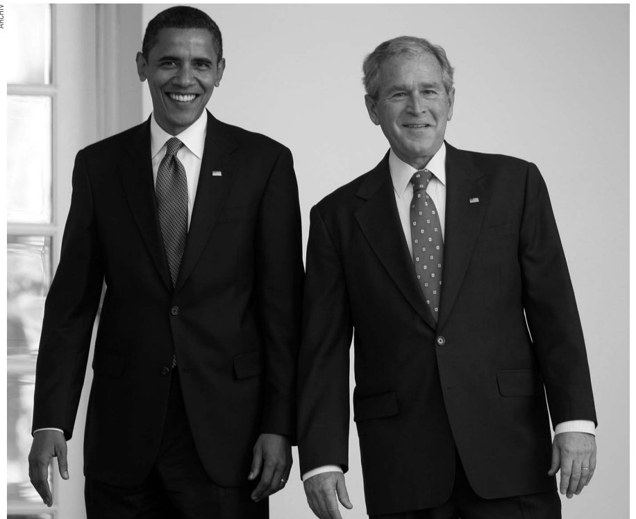
Seite an Seite, Lächeln für die Presse: Doch in Wahrheit liegen Welten zwischen Bush und Obama.

Studien bei 75 Prozent. In Deutschland wäre eine Genehmigung zu dieser Therapie wohl kaum erteilt worden, zumal bereits seit 2006 publizierte Daten aus Portugal vorliegen, die nicht nur die Sicherheit des Einsatzes patienteneigener, adulter Stammzellen belegen, sondern auch deren therapeutischen Nutzen zeigen. Das ist kein Fortschritt nach menschlichem oder auch nur medizinischem Maß, sondern im wahrsten Sinne des Wortes Politik auf dem Rücken von Pa-