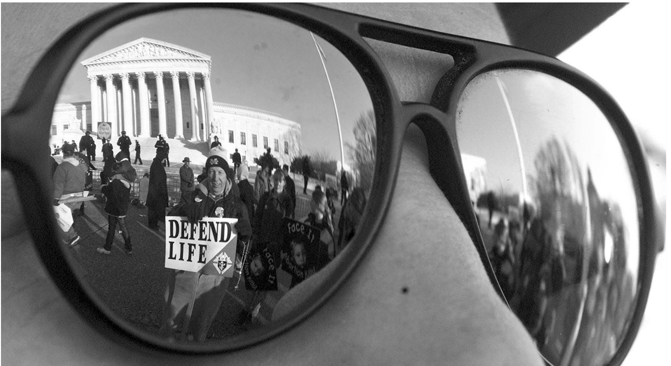
Aufgepasst: Lebensrechtler werden sehr genau beobachten müssen, was Obama in Fragen, die den Lebensschutz betreffen, alles plant.

bungseinrichtung auf eine Klassenkameradin, die ihr entgegenhält: »Wusstest du, dass dein Baby schon Fingernägel hat?« Gewebestücke, die Bestandteil des mütterlichen Organismus sind, verfügen in der Regel nicht über Fingernägel. Juno macht kehrt, bekommt das Kind und gibt es zur Adoption frei; an ein Paar, das sie sich vorher sorgfältig ausgesucht hat. Der Film war in den USA außerordentlich erfolgreich – trotz (oder gerade wegen?) seiner klaren Pro-Life-Botschaft.