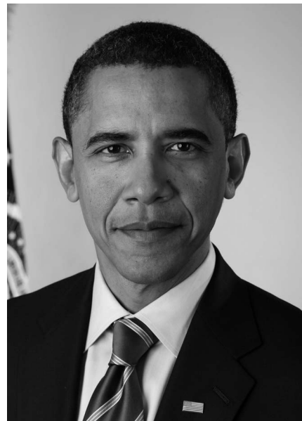
US-Präsident Barack Obama

Zunächst müssen wir mit den Demokraten zusammenarbeiten. Wir müssen die echten Pro-Life-Demokraten ausfindig machen und unterstützen. Es gibt Demokraten, die in Angelegenheiten des Lebensschutzes sehr gut abgestimmt ha-