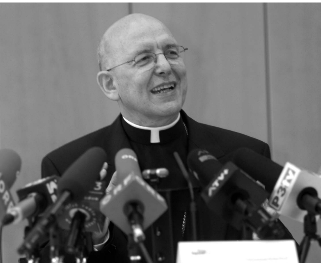
Der Bioethik-Spezialist der Österreichischen Bischofskonferenz: Bischof Klaus Küng

negativen Ergebnis gekommen. Das Hauptproblem besteht darin, dass man der Leihmutter, und damit sehr großen Problemen, Tür und Tor öffnen würde. In Amerika gibt es angeblich Frauen, die eigentlich ganz gerne ein Kind hätten, aber wegen der beruflichen Karriere lieber nicht selber schwanger sein wollen, sondern sich Eizellen entnehmen lassen und eine Leihmutter engagieren; manche wollen ein Kind, aber nicht unbedingt einen Mann. Die moralischen Fragen, die entstehen, sind sehr schwierig, Kinder werden zum Spielball persönlicher Wunschvorstellungen. Aber auch wenn man bei pränataler Adoption von lauterer Absicht ausgeht und versucht, durch gesetzliche Regelungen möglichst