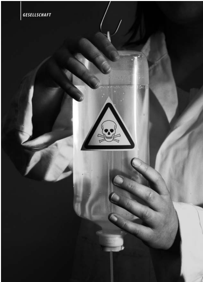
Die Debatte um die begleitete Selbsttötung geht weiter: Mitglieder des Deutschen Ethikrates streiten über die Suizidbeihilfe von Ärzten.