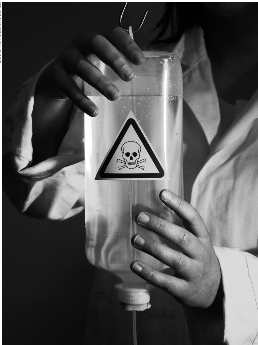
Bald vielleicht schon bittere Realität: Ärzte und Mediziner als Suizidhelfer.

seits sei »uns dieses Unbehagen ja nicht fremd: An einer Abtreibung verdienen