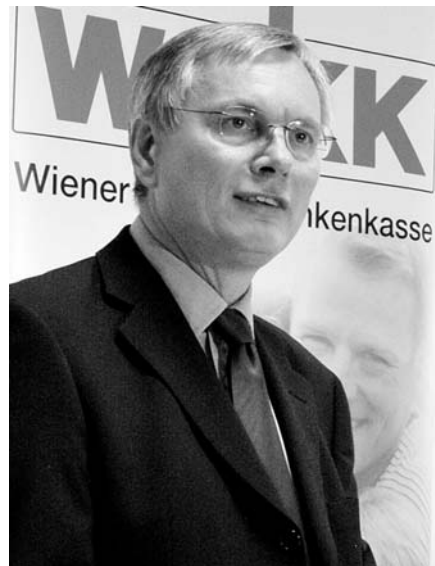
Alois Stöger, Gesundheitsminister in Österreich

nister Stöger an: »Es ist befremdend zu sehen, dass der Staat immer mehr nach den Kindern und Jugendlichen greift und dabei die Eltern und ihre Rechte übergeht und ausschaltet. Die rezeptfreie »Pille