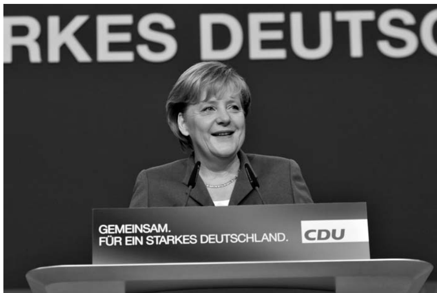
Sorge in Karlsruhe dafür, dass alles mit rechten Dingen zugeht: Angela Merkel.

Bundesminister für Wirtschaft und Technologie lässt keine Zweifel daran, dass er einen Unterschied zwischen einer befruchteten Eizelle in einer Glasschale und