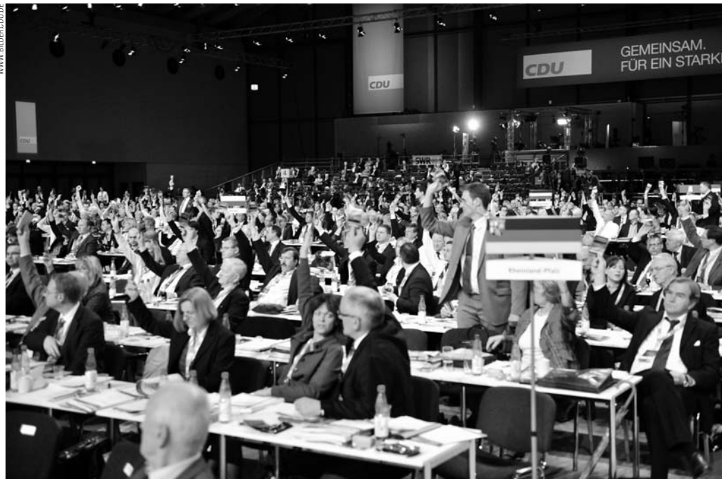
Gut gefüllt: Die Karlsruher Messehalle beim 23. Bundesparteitag der CDU.