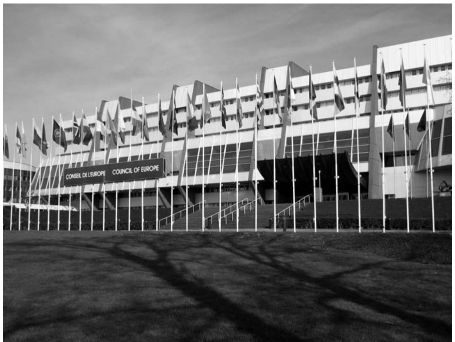
Die »Softlaw«-Schmiede: Der Europarat in Straßburg.