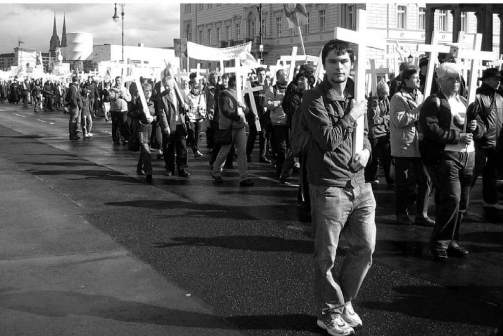
Die Marschteilnehmer ließen sich trotz militanter Gegendemonstranten nicht aus der Ruhe bringen.

Der Hass der Gegendemonstranten richtet sich gegen den Marsch, aber auch