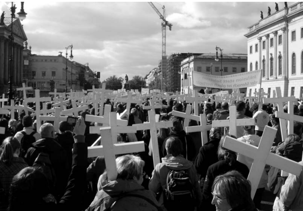
Ein Heer aus weißen Kreuzen: der diesjährige Marsch für das Leben.