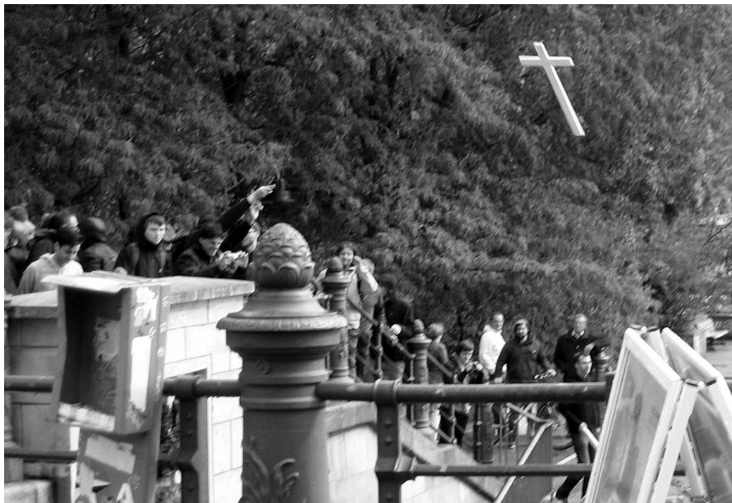
44 dieser Kreuze fischte die Polizei anschließend aus der Spree.

tionsdiagnostik (PID) gesetzlich zu verbieten, die geltenden Abtreibungsgesetze und ihre Praxis einer gründlichen und umfassenden Prüfung und Korrektur zu unterziehen, dem erneuten Aufkommen von Sterbehilfe/Euthanasie Einhalt zu gebieten sowie die Finanzierung der Ab-