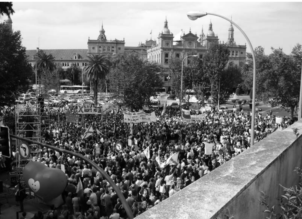
ALEXANDRA MARIA LINDER

vor der Tür) saßen die Kongressteilnehmer beim Mittagessen. Eine etwas skurrile Atmosphäre, unter deutlich hörbaren »Mörder!«-Rufen gemütlich Rotwein zu trinken und ein spanisches Menü zu genießen, was den etwas angestrengt um Humor und Gelassenheit bemüht speisenden Abtreibern auch nicht ganz schmeckte. Im Plenum groß angekündigt wurden eine »Pro-choice«-Demonstration am Samstagabend um 21 Uhr an der Kathedrale von Sevilla und eine weitere vor dem Restaurant am anderen Ufer des Guadalquivir, wo ein fröhlicher Flamenco-Abend stattfinden sollte. Die eine Pro-choice-Demonstration vor der Kathedrale war wegen der peinlichen Teilnehmerzahl nach einer Viertelstunde stillschweigend beendet worden und auch die andere Demonstration besaß nicht ansatzweise die Menge und die Aufmerksamkeit wie