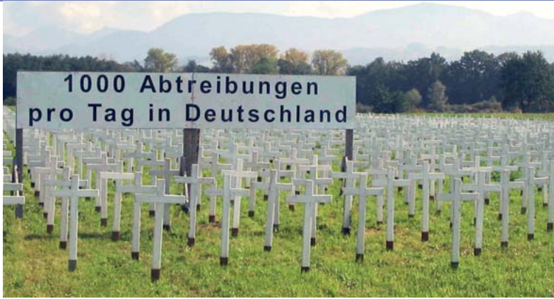
Der ALfA-Regionalverband Rosenheim packte kräftig mit an, damit das 1000-Kreuze-Feld des Durchblick e.V. auch zum Stehen kam.

ganze Menschheit ausstirbt!« Damit war die Diskussion beendet.