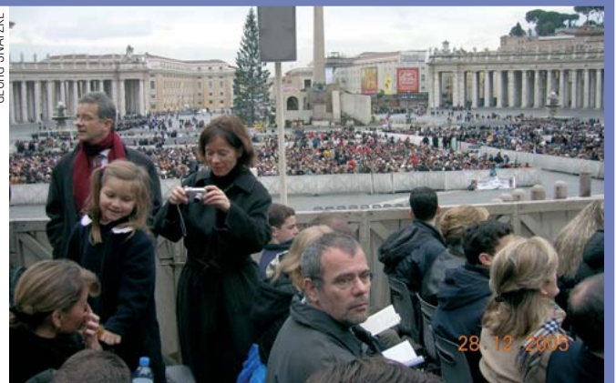
Warten auf Papst Benedikt XVI.: Lebensrechtler der ALfA reisten zur Generalaudienz am 28.12.2005 auf dem Petersplatz nach Rom.