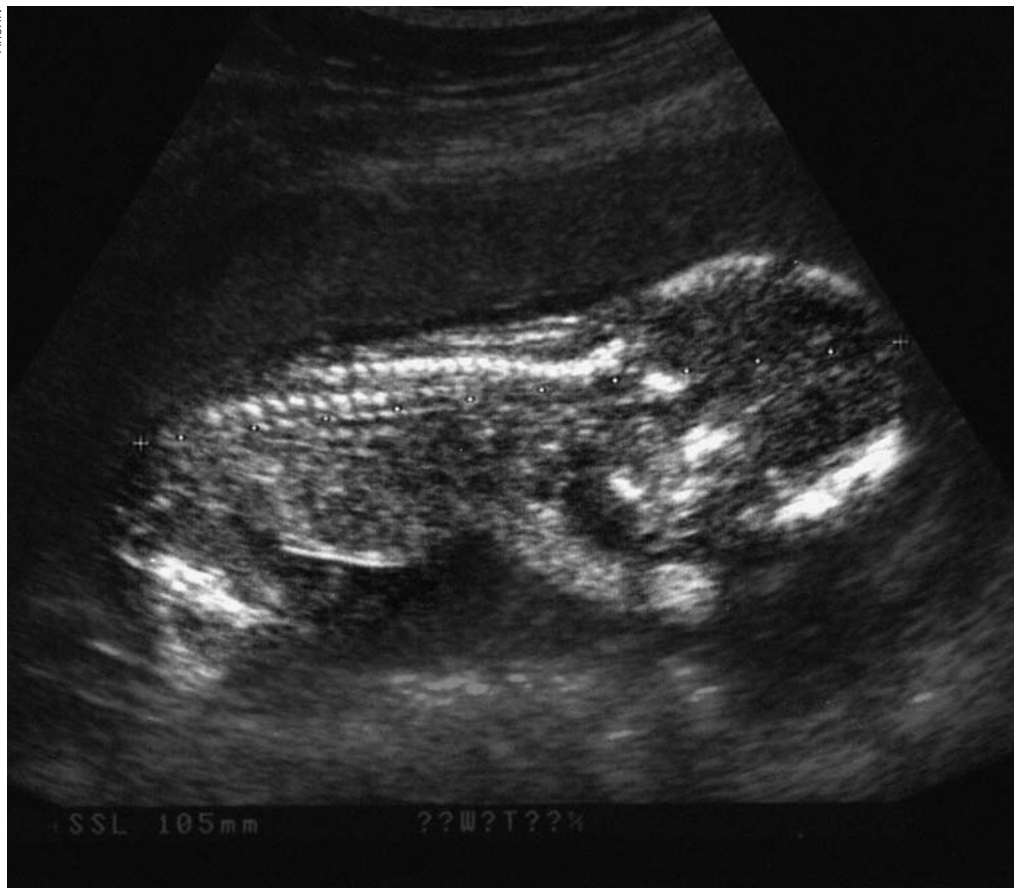
Deutlich im Ultraschall zu erkennen: Der ungeborene Mensch.

erkennt und welch ein Wunder sich da im Verborgenen entwickelt!