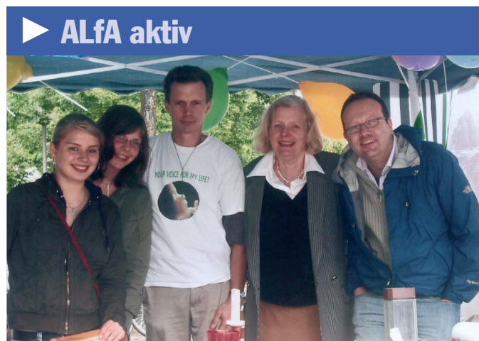
Frühzeitige Beratung und Aufklärung am ALfA-Stand