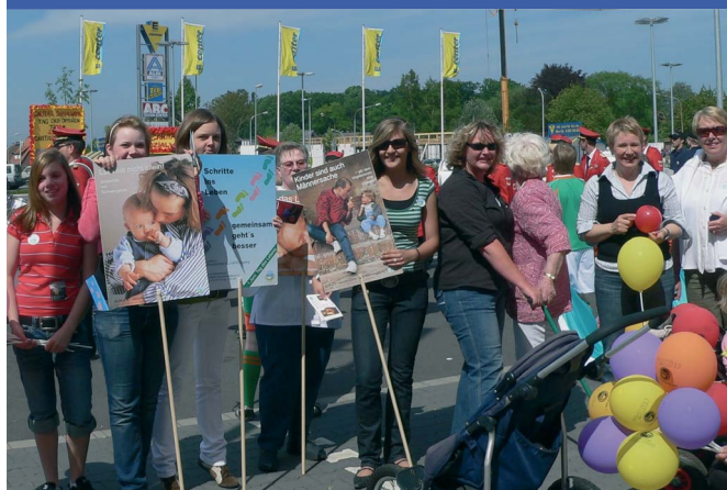
ALfA-Mitstreiter auf dem Stadtjubiläum