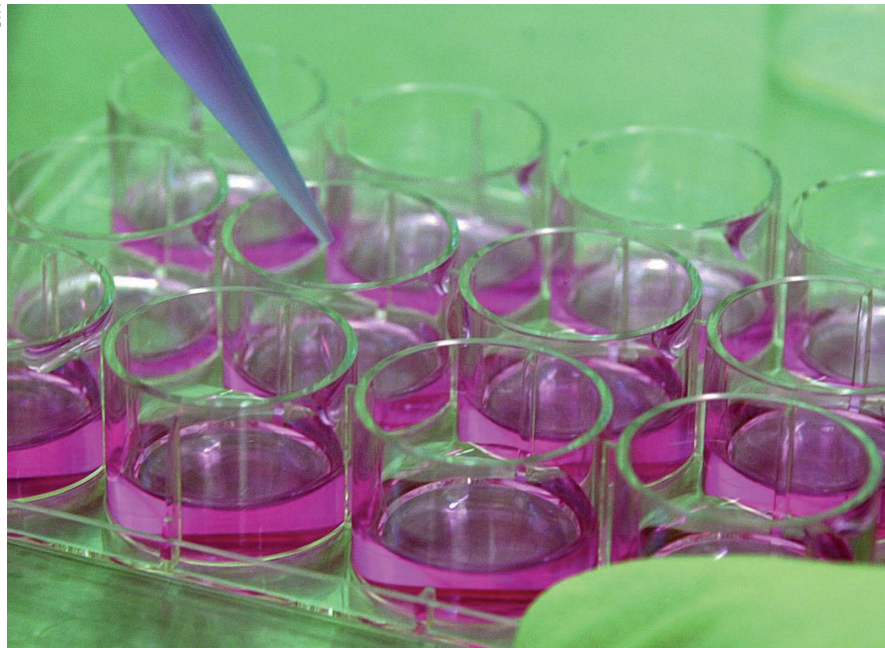
Ethisch heilen: Adulte Stammzellen in Kultur

das nicht weiter. Adulte Stammzellen heilen also schon. Wissen, wo sie am Herzen reparieren müssen. Ich frage den Professor, ob da nicht beim diabetischen Fuß, bei Gangrän und offenen Wunden auch etwas zu machen sei mit adulten Stammzellen.