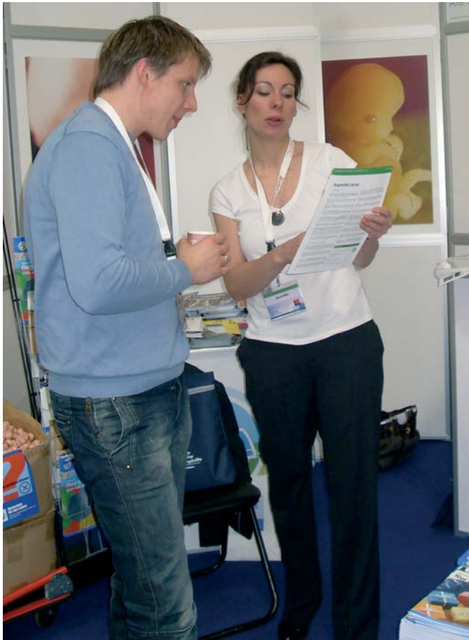
Stand der ALfA auf dem Kongress Christlicher Führungskräfte

Auf dem Kongress Christlicher Führungskräfte in der Düsseldorfer Messe (26.-28.2.2009) war erstmals auch die Aktion Lebensrecht für Alle e.V. (ALfA) mit einem Stand vertreten. An dem hochkarätig besetzten Treffen nahmen fast 4000 Menschen teil.