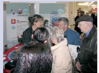
Gut besucht: Der Stand der ALfA

Die inzwischen regional etablierten »Memminger Gesundheitstage« standen heuer mit 57 Ausstellern und 35 Fachvorträgen von Gesundheitsexperten unter dem Motto: »Zeit für Gesundheit«. Erstmals hat auch der ALfA-Regionalverband Memminger-Unterallgäu mit einem eigenen Infostand an den nunmehr 12. Gesundheitstagen der Stadt Memmingen teilgenommen. Rund 10.000 Besucher boten uns von 6. bis 8. November die Möglichkeit zu guten Gesprächen am ALfA-Stand; dabei erlebten unsere Helfer fast nur positive Resonanz. Das ausgelegte Infomaterial, ganz besonders die Broschüre »Gesundheitliche Folgen nach einer Abtreibung« (unser Anknüpfungspunkt für die Ge-