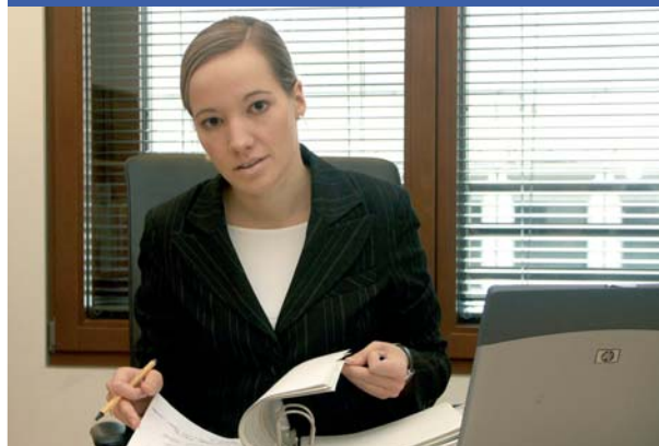
Familienministerin Kristina Schröder, CDU