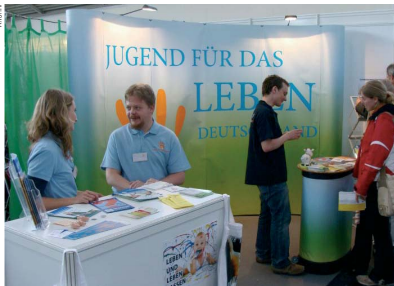
Neu gestaltet: Der Info-Stand der Jugend für das Leben.