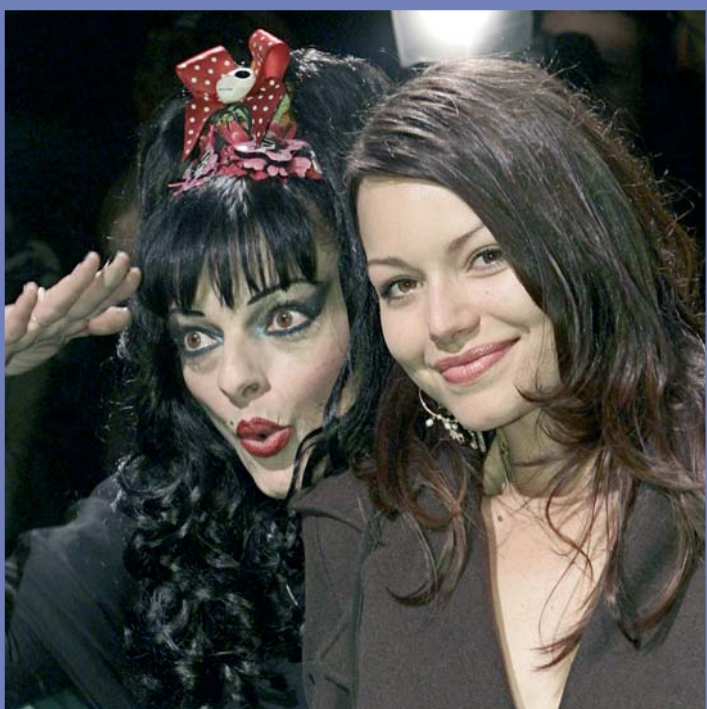
War nicht immer so glücklich wie hier: Nina Hagen (l.) mit Tochter Cosma Shiva.