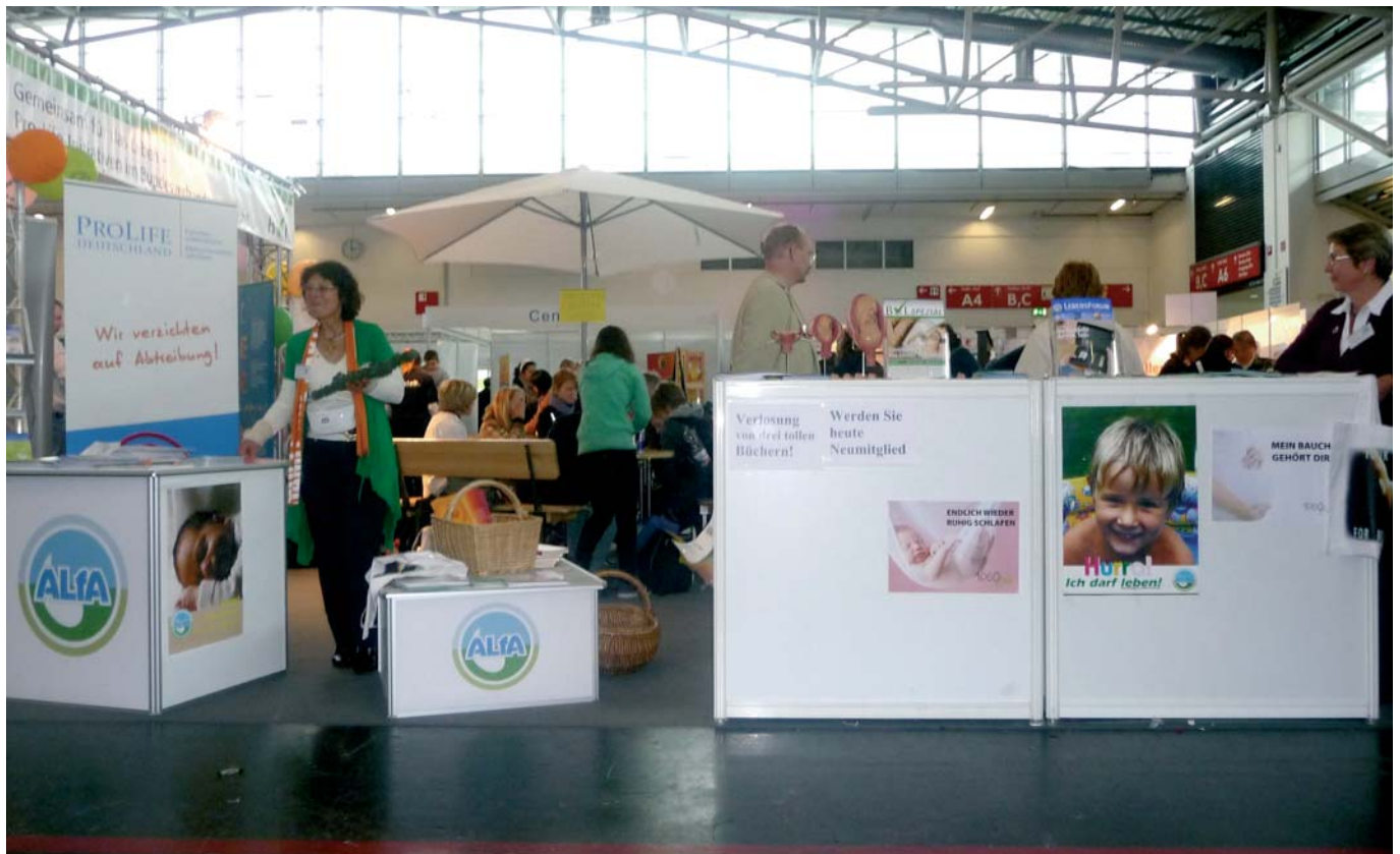
Der Info-Stand der ALfA auf dem 2. Ökumenischen Kirchentag auf dem Münchner Messegelände.